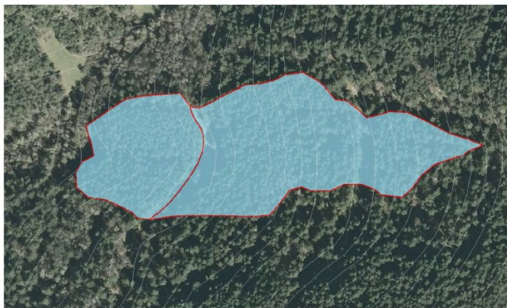
Imagen 1: Rodales 8b y 1g, clara en pino laricio