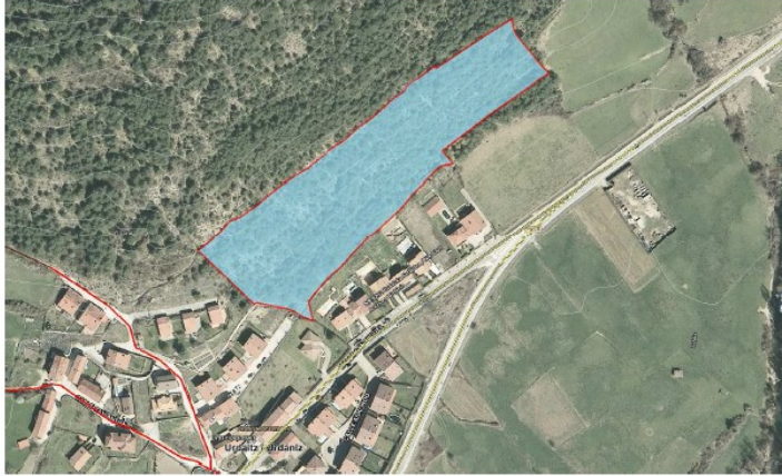
Imagen 3: Rodal 3c, corta a hecho de pino silvestre

CONCEJO DE URDANIZ URDAITZ KONZEJUA C/ San Miguel, 19. 31698 URDAITZ/URDANIZ e-mail: urdaitzurdaniz@gmail.com