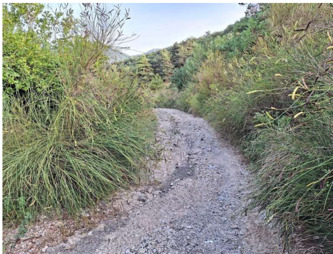
Imagen 3: Camino del repetidor, Irotz. Estado actual.-

Referencia catastral: Referencia catastral propia Esteribar, polígono 4, parcela 91.860.