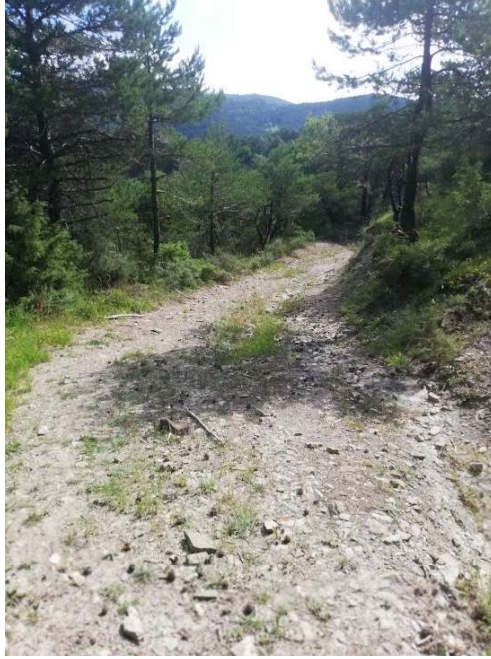
Imagen 9: Leranotz. Camino de las palomeras. Estado actual.-