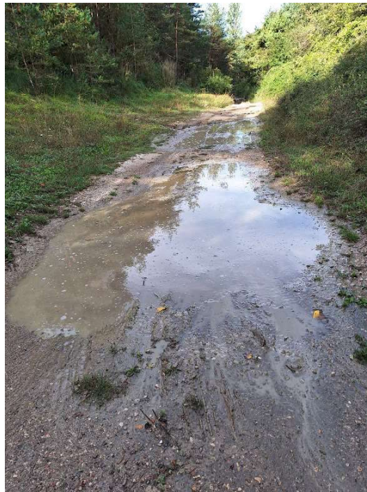
Imagen 5: Camino Mindegi, Ilurdotz. Estado actual.-