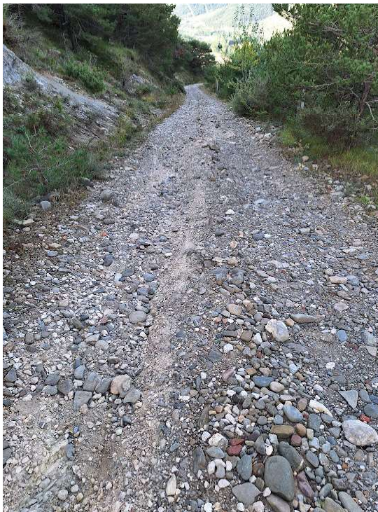
Imagen 4: Camino del repetidor, Irotz. Estado actual.-