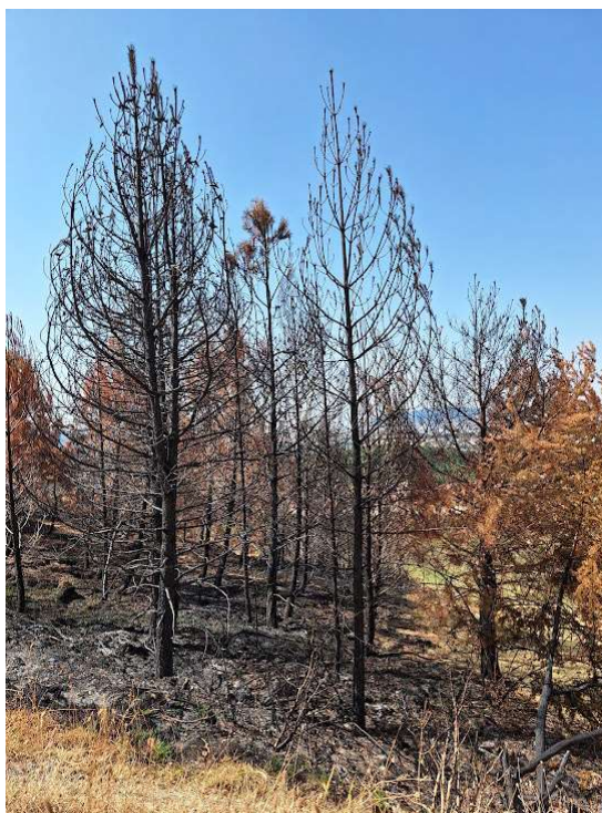
Imagen 8: Pies objeto de trituración en la parcela 1/230 A.-

La trituración de monte en pie (1/230 A) corresponde al monte incendiado el pasado mes de julio. Los árboles presentan una altura media de 5-6 metros, y un diámetro normal de 8-12 cm. Con la actuación se pretende mejorar la regeneración (rotura de serótinas y diseminación de piñones), efectuar una actuación extratemprana para evitar daños posteriores al regenerado, proteger el suelo desnudo por recubrimiento con los fragmentos de trituración, así como atenuar la fuerte incidencia paisajística asociada a masas incendiadas, en especial en un área de máximo potencial de vistas.