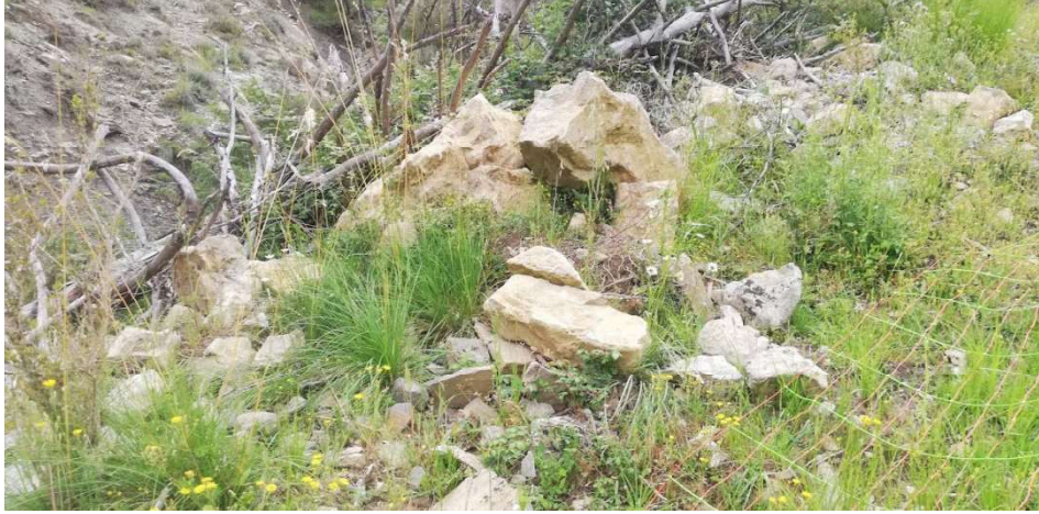
Imagen 6: Para la construcción del pedraplen se aprovecharán los acopios de piedra existente en las proximidades del camino.-