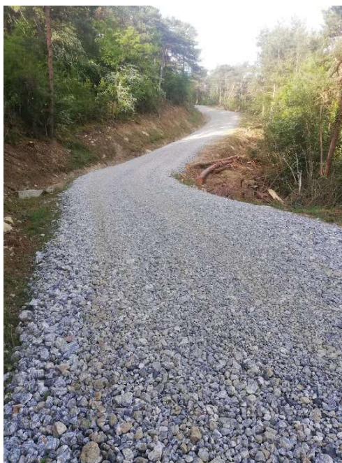
Imagen 1: Parte del afirmado se efectúa sobre tramos con subbase saneada con magnesita en el marco del Next Generation.-

Antecedentes : El presente año dicho camino fue objeto de una mejora sustancial en el marco del programa “Next Generation”. La inversión prevista pretende completar y afinar la previamente ejecutada para garantizar que la vía es transitable en su totalidad bajo cualquier circunstancia climática.