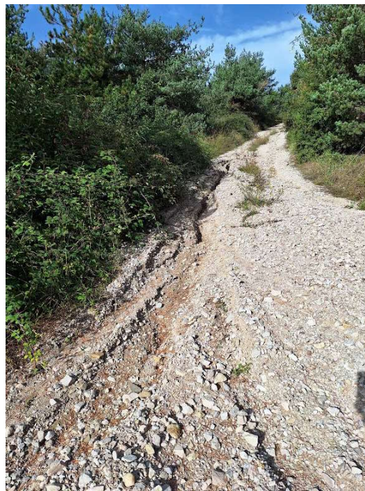
Imagen 2: Camino Zelaieta, Zuriain. Estado actual.-

Referencia catastral: Esteribar, polígono 7, parcela 91.110.