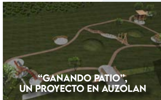
"GANANDO PATIO", UN PROYECTO EN AUZOLAN

El servicio de Asesoría Energética es gratuito y se ofrece mediante Cita Previa, o a través de consulta telefónica. Para concertar cita e información hay que llamar al tfn. 697 655 664 o enviar un mail a infoenergia@cederna.es.