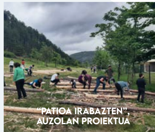
"PATIA IRABAZTEN", AUZOLAN PROIEKTUA

Energia Aholkularitzako zerbitzua doakoa da eta aurretiko hitzorduaren edo telefono bidezko kontsultaren bidez eskaintzen da. Hitzordua hartu eta informazioa eskatzeko, 697 655 664 telefono-zenbakira deitu edo bidali e-maila helbide honetara: infoenergia@cederna.es.