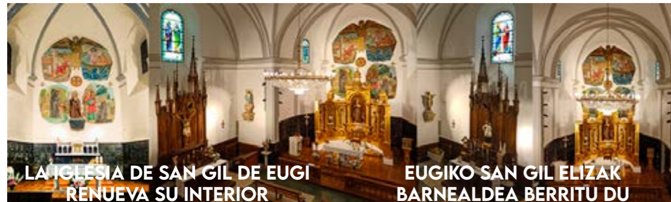
LA IGLESIA DE SAN GIL DE EUGI RENUEVA SU INTERIOR